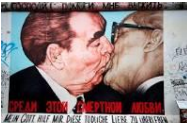
Et af de mest berømte malerier på "muren"