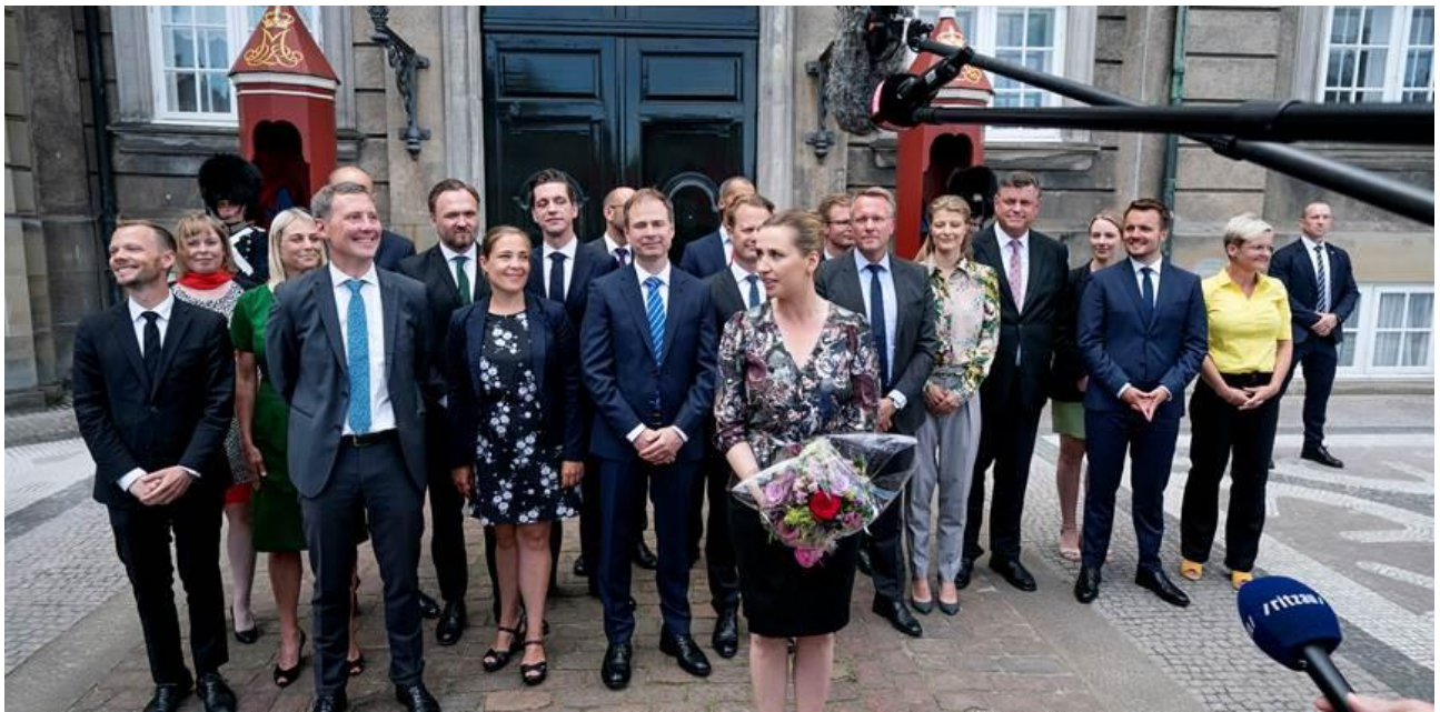
Det er hende i den gule bluse, der er vores undervisningsminister

Så var det ugen, hvor regeringen fremsatte deres finanslovsforslag, og der var nok nogen, der fik morgenkaffen galt i halsen, for de værste gisninger blev indfriet. Hvis lovforslaget bliver vedtaget uden ændringer, betyder det en nedgang i vores tilskud på omkring 165000kr/år. Men der er enkelte lyspunkter, som jeg hurtigt vil fortælle om. For det første er det kun et forslag. Nu skal forhandlingerne i gang, og der er ikke mange partier i Folketinget der bakker op om en nedgang i koblingsprocenten fra 76 til 71, som Socialdemokraterne stiller forslag om. De kommende forhandlinger vil vise, om der er vilje til at kæmpe friskolernes sag fra de andre partier. Forslaget træder først i kraft år 2021, så vi har næsten halvandet år til at forberede os, og som den sidste formildende fortælling, så er der afsat en pulje på 75 millioner til skoler som løfter eleverne socialt, som ligger ude på landet langt fra en folkeskole og som sidste pind; har et lavt socioøkonomisk indeks blandt forældregruppen. Jeg ved ikke om vi kommer i betragtning til disse midler; vi kender ikke endnu kriterierne for beregningerne. En fjerde pind, der peger i positiv retning,