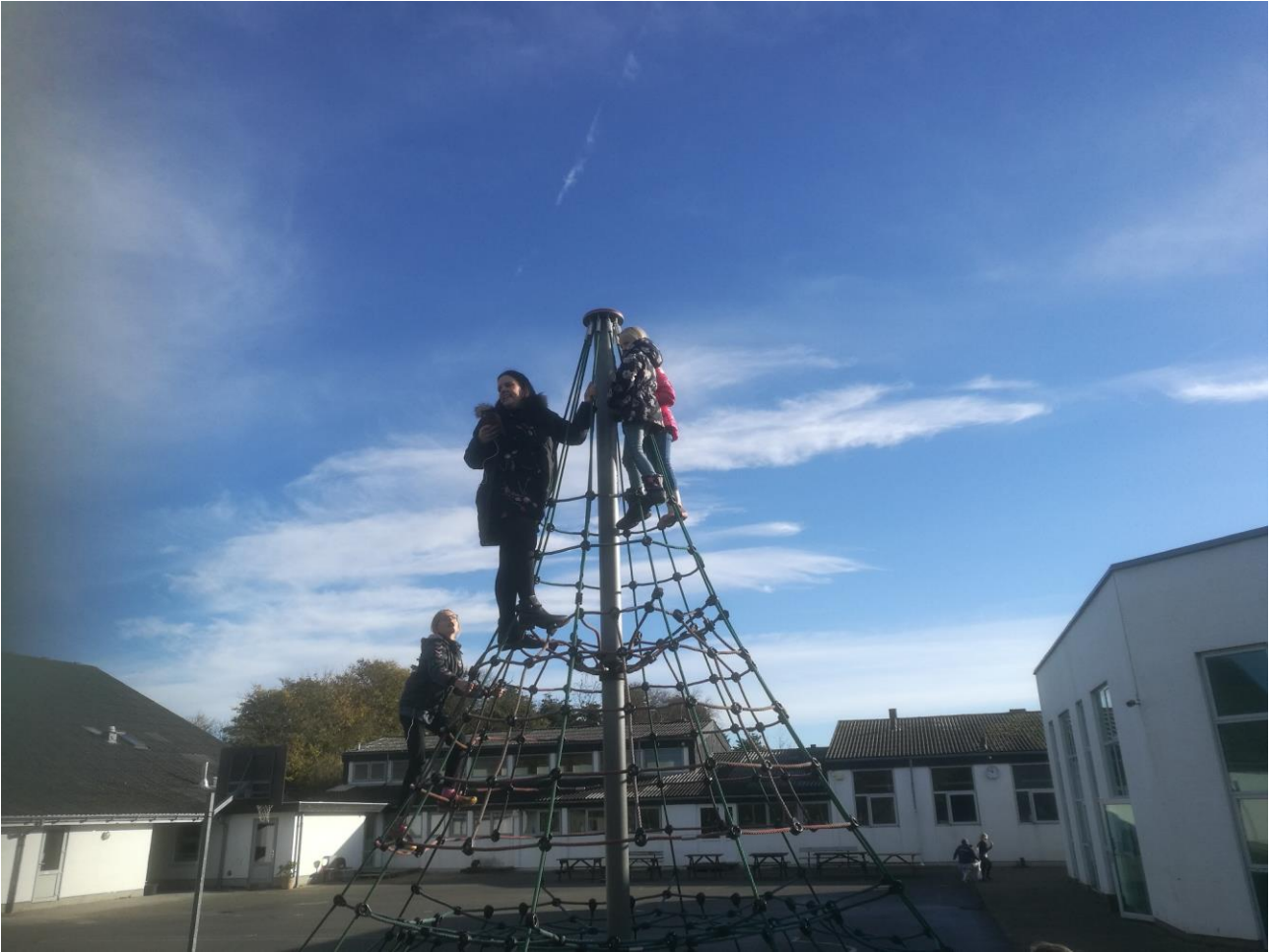
Gårdvagten er nødt til at stige til vejrs for at kunne holde øje med alle børnene, så store arealer har vi.